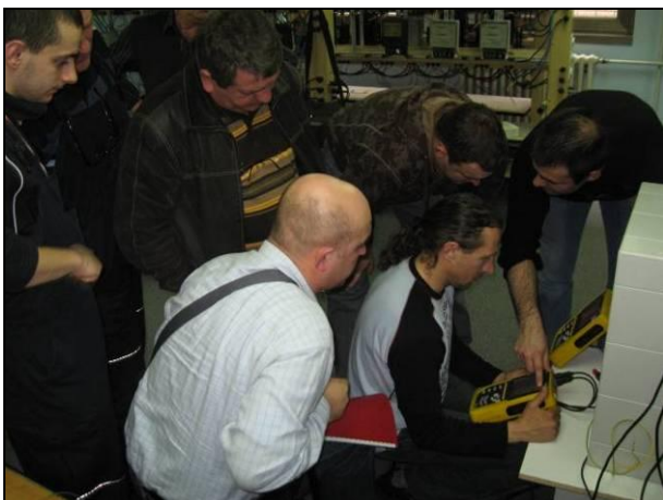
Slika 3. Rad sa mernom opremom

Laboratorijski deo obuke podrazumeva rad sa konkretnom mernom opremom u laboratorijskim uslovima, sa simulacijama neispravnosti i pokazivanjem načina primene merne opreme za njihovo otkrivanje. Prilikom laboratorijske obuke simulira se više vrsta neispravnosti kako bi se stekao bolji uvid o načinu primene merne opreme.