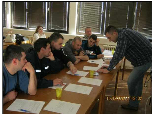
Slika 2. Principi primene merne opreme

Laboratorijski deo obuke podrazumeva rad sa konkretnom mernom opremom u laboratorijskim uslovima, sa simulacijama neispravnosti i pokazivanjem načina primene merne opreme za njihovo otkrivanje. Prilikom laboratorijske obuke simulira se više vrsta neispravnosti kako bi se stekao bolji uvid o načinu primene merne opreme.