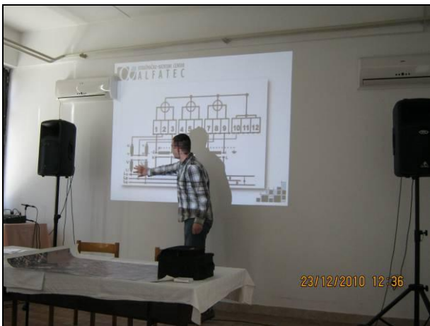
Slika 1. Principi povezivanja mernih grupa

Polaznici obuke pohađaju teorijski i laboratorijski deo obuke. Teorijski deo obuke obuhvata upoznavanje sa tehničkim aspektima kontrole mernog mesta, vrstama i načinima povezivanja mernih grupa, kao i principima primene različitih vrsta merne opreme za kontrolu mernog mesta.